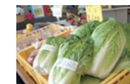
『さん直屋』さんでは、牡蠣はもちろん水産物のみならず松島産の米や野菜、特産品等が並ぶ。

松島の想いが詰まった牡蠣は、ハミ ングバード並びにグループ店の炙屋十兵 衛、南欧BARU INATŌRAにて提供いた します。ぜひ存分に味わってみてください!