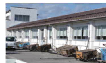
ボランティアで訪れた際とは違って変わって、すっかり命を吹き返した牡蠣むき工場。

向かった先は松島の磯崎地区で直売 店『さん直屋』も経営している『有限会社 F・F磯崎』さん。ボランティアツアーでお世 話になった磯崎地区漁業組合の共同工 場も使用しています。代表取締役の高橋