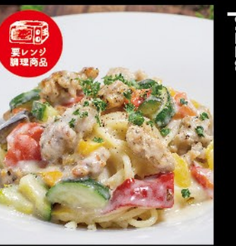
サルシッチャと彩り野菜の クリームソース 1,080