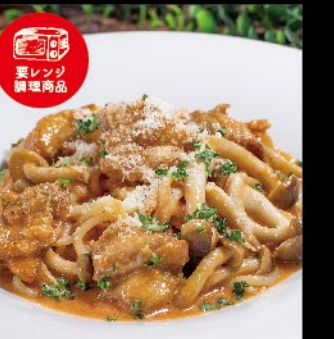
鶏肉とキノコの トマトクリームソース 1,080