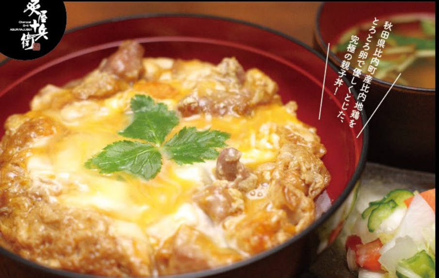
比内地鶏究極の親子丼 1,280