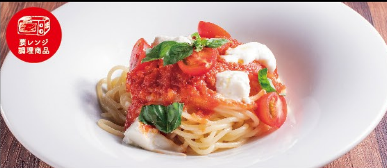
蔵王モッツァレラチーズとバジルのポモドーロ 1,000