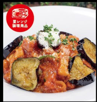
茄子とベーコンの トマトソース 1,080