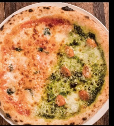
二つの味のマルゲリータ 1,400