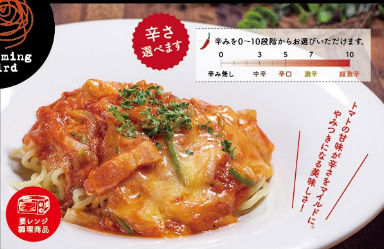
ベーコンとチーズの辛いトマトソース 1,080