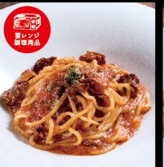
和牛スジ肉のデミグラス 煮込みソース 1,100