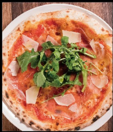
生ハムとルッコラ 1,400