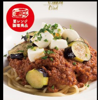
揚げ茄子と蔵王モッツァレラ チーズのミートソース 1,080