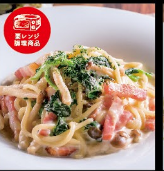
ベーコンとほうれん草と キノコのクリームソース 980