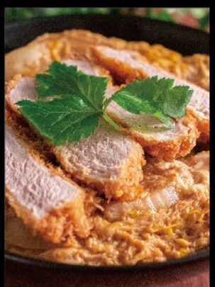
熟成豚のヒレカツ丼 1,180