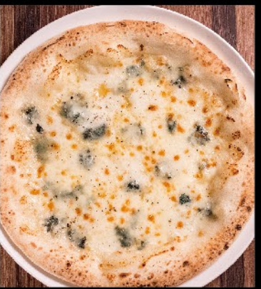
クワトロフォルマッジ 1,350