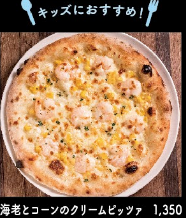
海老とコーンのクリームピッツァ 1,350 ・ソーセージとコーンのピッツァ 1,350